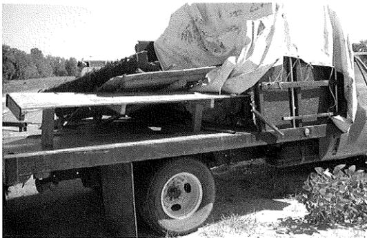
Vista del lado del pasajero del camión.

Un tractor remolque de 18 ruedas, conducido por un residente de Carolina del Norte con licencia de conducción del mismo estado, viajaba en dirección norte por la autopista 11. El tractor remolque se acercó al camión con la intención de pasarlo sobre la autopista 11. En ese momento, el tractor remolque giro hacia la izquierda, mientras que el camión intento pasarlo cruzando sobre la doble línea amarilla en el carril contrario; en ese momento se produjo el accidente. Cinco pasajeros que viajaban en la plataforma de carga fueron arrojados del vehículo en el momento del impacto. Un trabajador agrícola murió instantáneamente. Los otros cuatro resultaron gravemente heridos y fueron llevados a hospitales del área. Los tres empleados en la cabina del camión, incluido el conductor, tuvieron heridas leves. La Patrulla de Carreteras del Estado investigó el accidente y citaciones fueron consideradas para el conductor del remolque del tractor, por pasar de manera inadecuada.